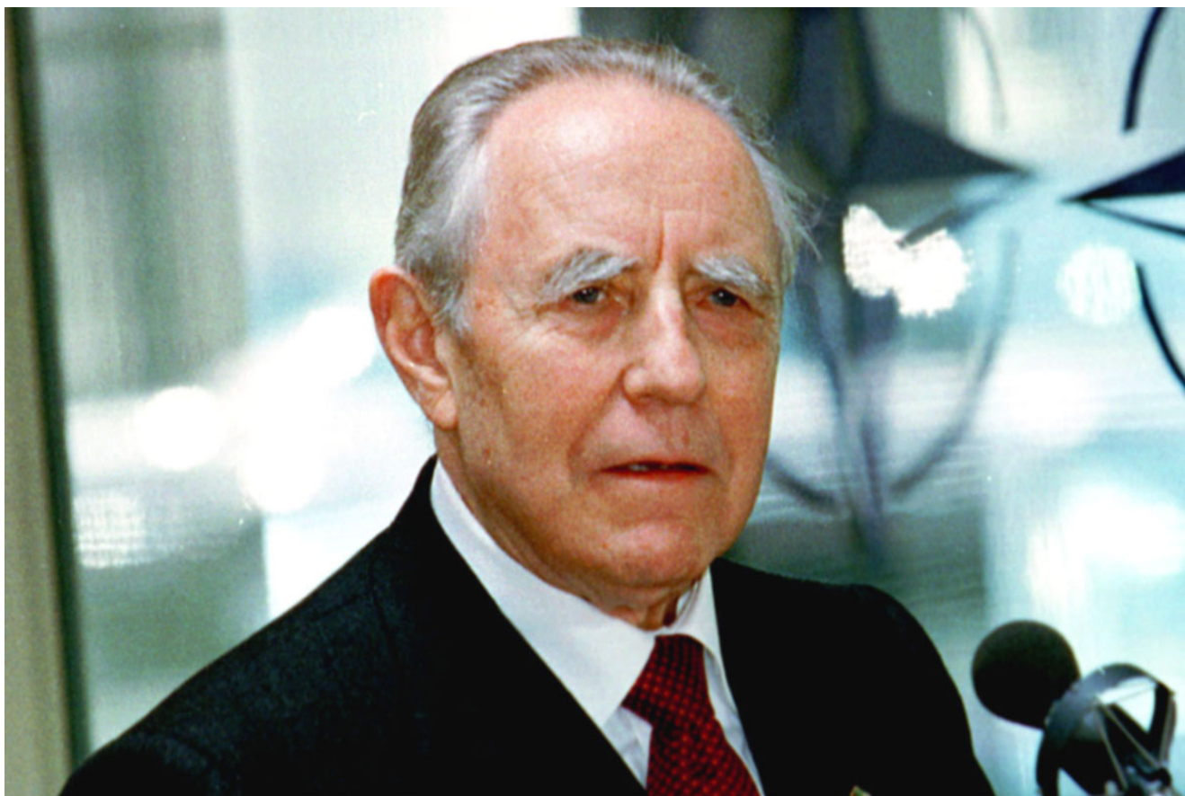
Carlo Azeglio Ciampi, un piccolo padre per la nostra patria

Carlo Azeglio Ciampi è stato un padre della patria. Nessuno lo metta in dubbio: Governatore della Banca d'Italia, Presidente del Consiglio, Ministro del Tesoro, Presidente della Repubblica, Senatore a vita. E come avrebbe fatto qualsiasi buon padre della patria, ha aperto le porte alla privatizzazione dei beni dello stato , ha rinunciato alla sovranità monetaria regalando la Banca d'Italia ai banksters, ben sapendo a che cosa andavamo incontro, ha svenduto l'Italia ai poteri finanziari forti, ha regalato le immense riserve valutarie agli speculatori, ha barato per far entrare l'Italia nel giogo dell'euro. Eh si, Carlo Azeglio Ciampi è stato un vero padre della patria. Dobbiamo essere orgogliosi. Tutti ne dobbiamo parlar bene.