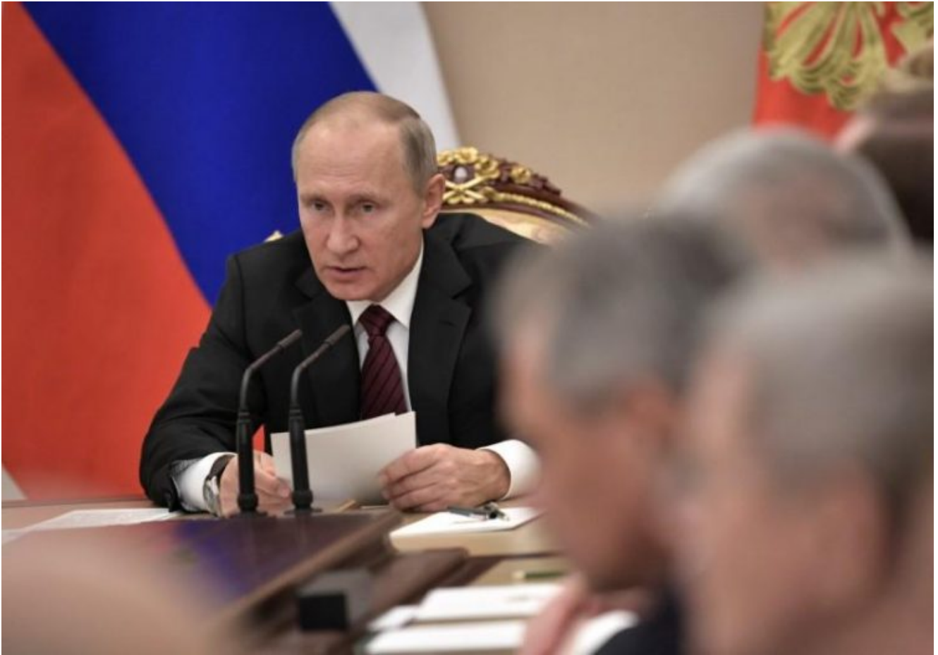
Conferenza stampa di Putin

Bisogna sapere che dal 2012 in tutti i 93 mila seggi elettorali russi sono state installate telecamere proprio per accrescere la trasparenza delle operazioni e contrastare l'accusa, elevata dalle note centrali occidentali, che le elezioni in Russia sono truccate per fare eleggere Putin. Da un sito web aperto nel 2012, chiunque sia interessato può guardare le operazioni di voto in qualunque seggio del paese. Ma per quanto di valore civico, la visione non è, ammettiamolo, tanto appassionante da attrarre un milione di spettatori dall'estero. Da cui il sospetto che Borisov ha espresso ad alta voce.