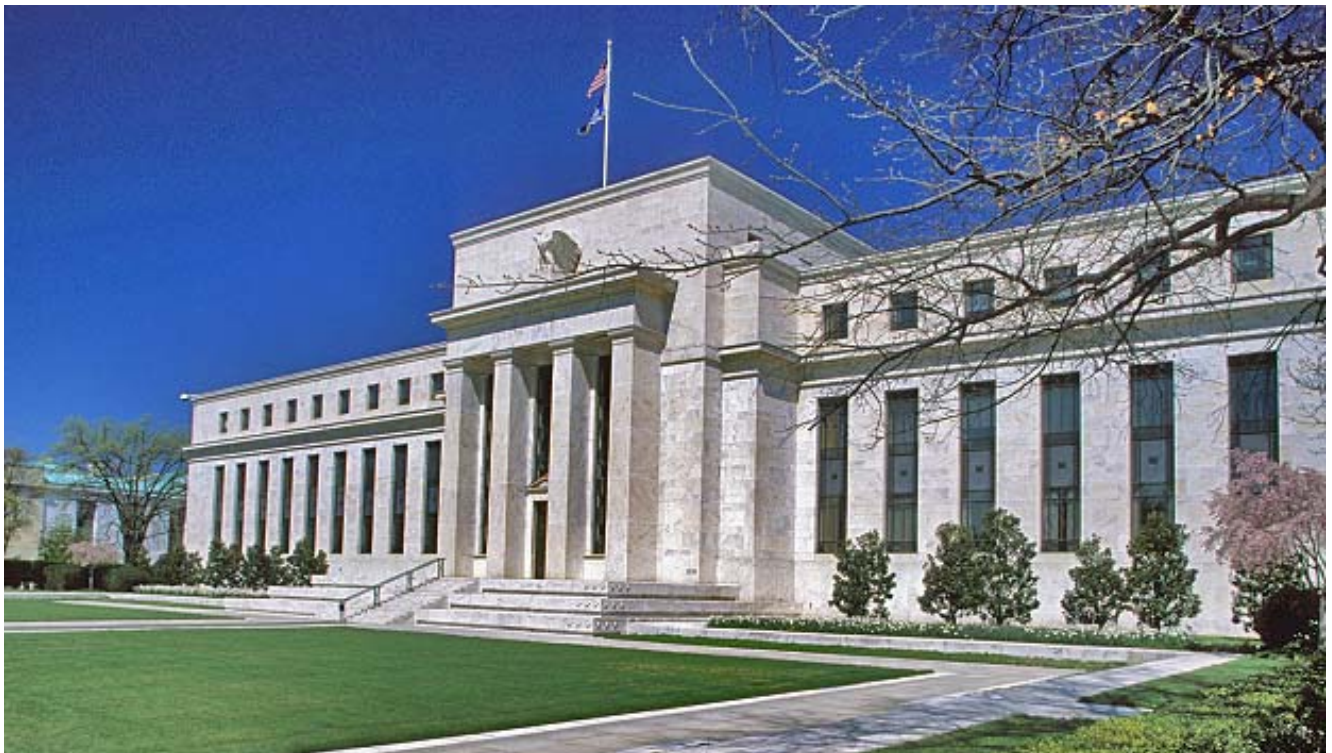
Sede della Federal Reserve

La Federal Reserve venne progettata per creare debito, e i banchieri di Wall Street erano molto entusiasti di un tale sistema perché li avrebbe resi ancora più ricchi. Da quando la Fed è stata creata nel 1913, il debito nazionale degli Stati Uniti è aumentato di oltre 5000 volte e il valore del dollaro USA è diminuito del 98% circa. Quindi la Federal Reserve non sta facendo altro che portare avanti il progetto originario. In effetti, sta funzionando in modo egregio, molto meglio di quanto i suoi stessi progettisti avessero potuto immaginare.