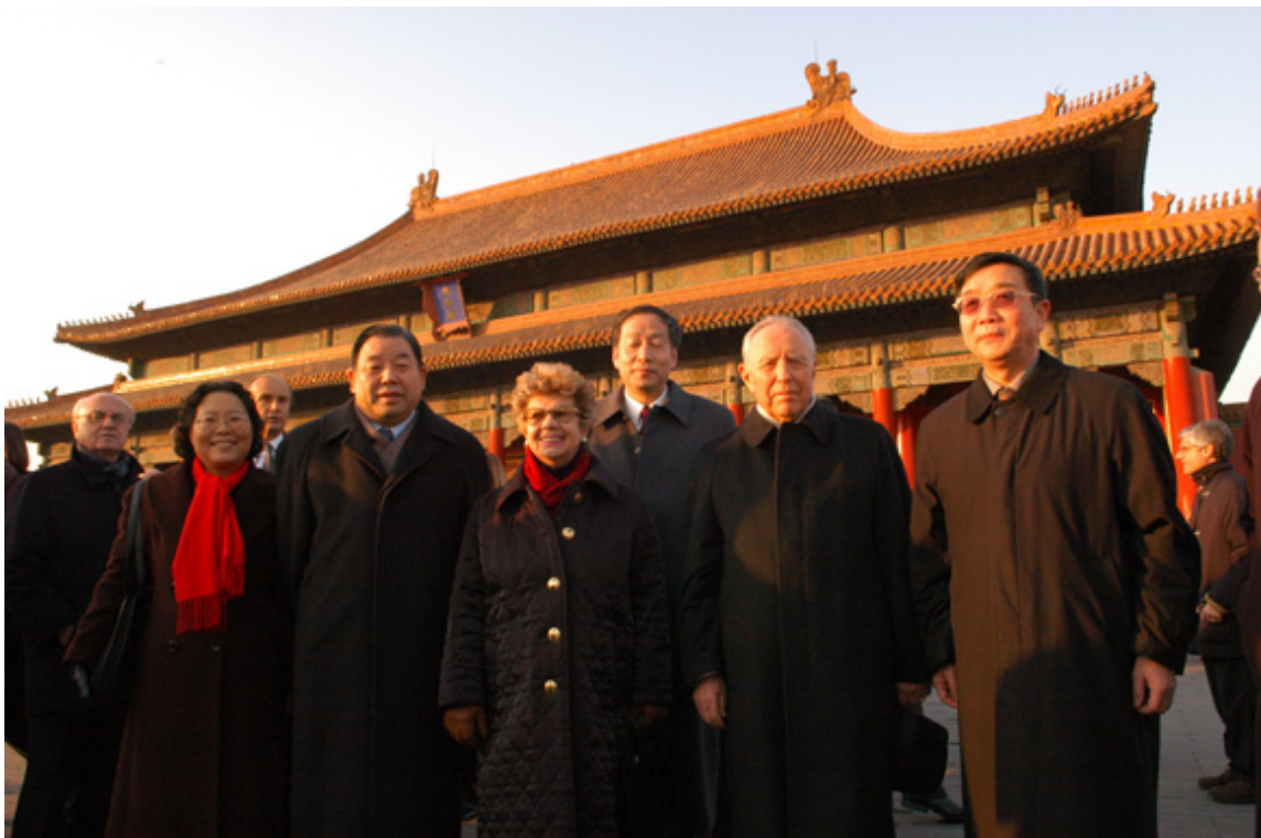
Il Padre della Patria Carlo Azeglio Ciampi e la

Naturalmente, i risparmi realizzati dagli industriali si sono trasformati in maggiori utili , perché i prezzi l'oro signori non li hanno abbassati. Capisco gli industriali, parlavano a nome dell'Italia, ma facevano i propri interessi. Mi chiedo però che ci facevano in Cina il padre della patria Carlo Azeglio Ciampi e gli altri quattro ministri . Loro non sapevano che stavano distruggendo l'occupazione in Italia? Nel migliore dei casi erano degli incoscienti, nel peggiore erano proprio questo quello che volevano.