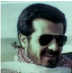
(Bassel el Assad – ucciso come Haider?)

Già, che coincidenze tristi. Il figlio maggiore di Assad padre, che doveva succedergli, era Basil el-Assad : ingegnere, colonnello, paracadutista, morì alle prime luci dell'alba mentre guidava la sua Mercedes. Andava a prendere un aereo per la Germania. La sua auto sbatté contro una rotonda nella superstrada deserta. Aveva 33 anni.