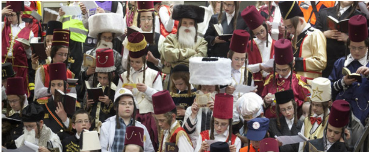
Bambini festeggiano il Purim

Questo piccolo, ma significativo sterminio, è raccontato nel Libro di Ester (Meghillàth Estèr), libro che fa parte del canone biblico. La festa del Purim dura due giorni, tra banchetti, scambi di doni, dolci e dolcetti, travestimenti carnevaleschi, lettura del Libro di Ester , ed è particolarmente amata dai bambini.