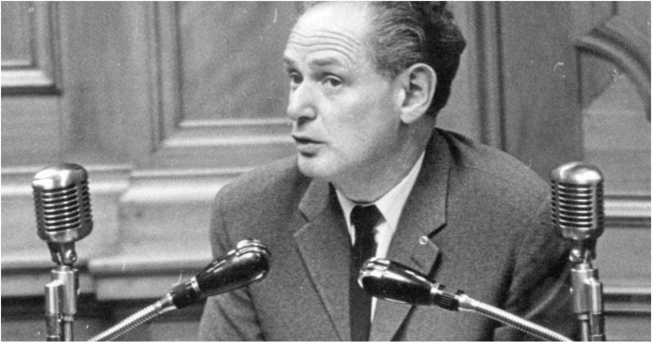
Gunnar Heckscher, politico svedese