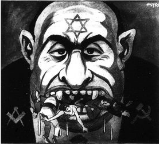
Ein Volk zu knechten liegt dem Juden fern Er hat die ganze Welt zum Zerkleinern

SHOWN IN "DER STÜRMER", June 1931 IN A RUT (TREADMILL) In der Zerkleinerung